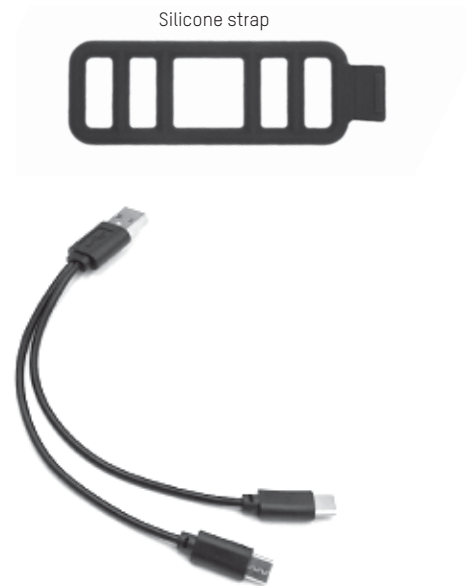
Dual-head cable USB-A to USB-C Câble de chargement USB à double embout Zweifach-USB-Ladekabel