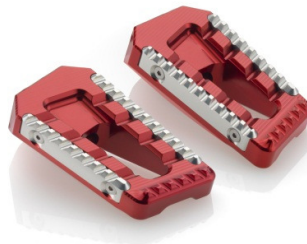
Austauschraste, Ausführung PE622