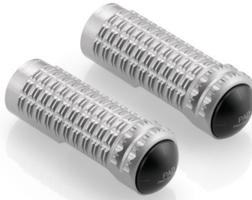
Austauschraste, Ausführung PE630