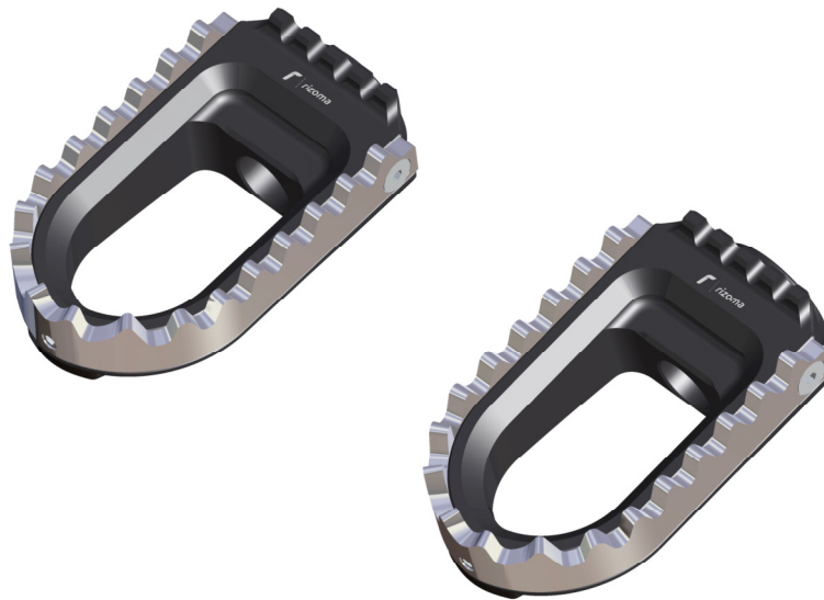
Austauschraste, Ausführung PE640