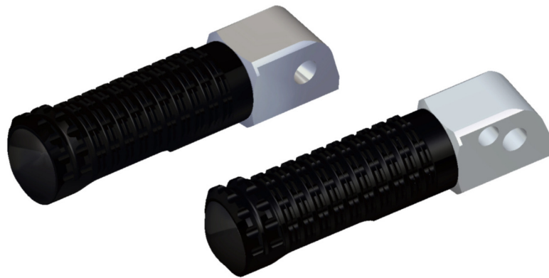
Austauschraste, Ausführung PE127