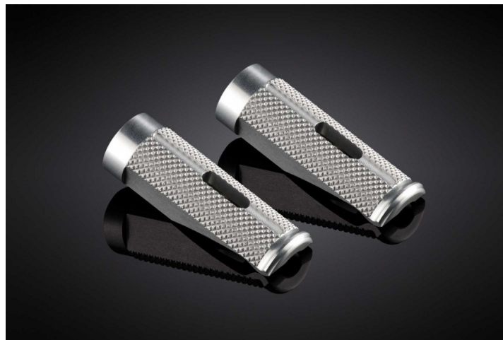
Austauschraste, Ausführung PE614