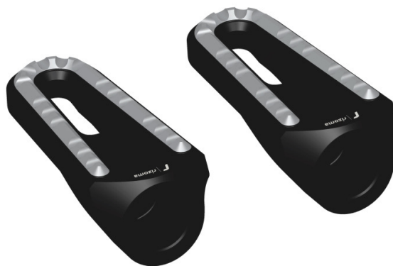
Austauschraste, Ausführung PE642