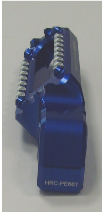
Austauschraste, Ausführung HRC PE661