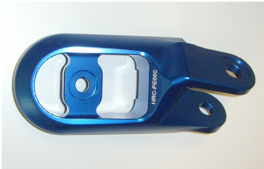
Austauschraste, Ausführung HRC PE660