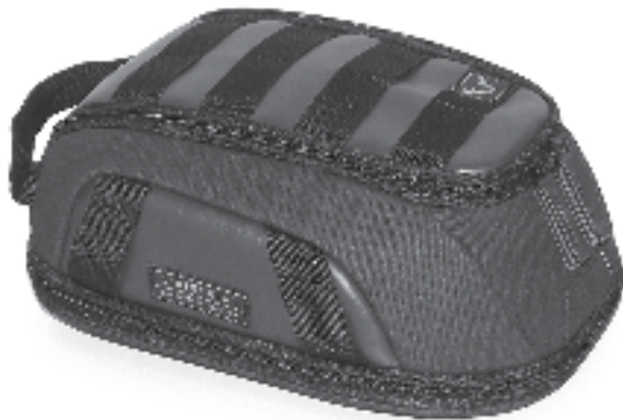
1 1x Tankrucksack LT1 Tank Bag LT1