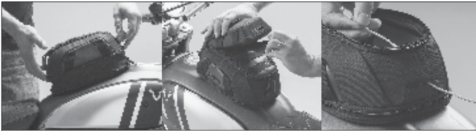
Features (von links nach rechts): Volumenerweiterung (3 l zu 5,5 l); Universelles Befestigungssystem; Kabeldurchlass. Features (from left to right): Volume expansion (3 l to 5.5 l); Universal fixation system; Cable feed-through.